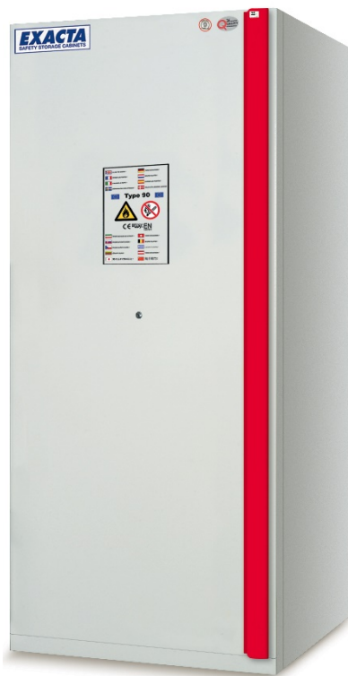
EFO 9 BASIC