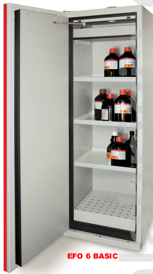
EFO 6 BASIC