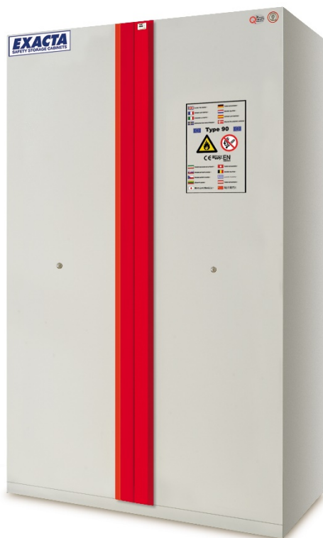
EFO 12 BASIC